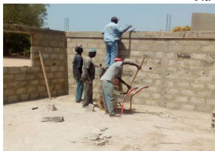
2 aangevers / 1 metselaar