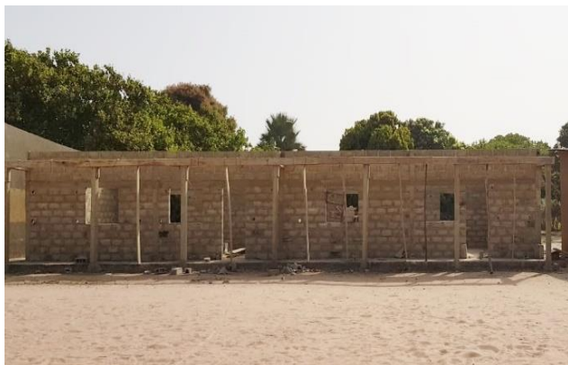
Voorkant 2 klaslokalen in aanbouw