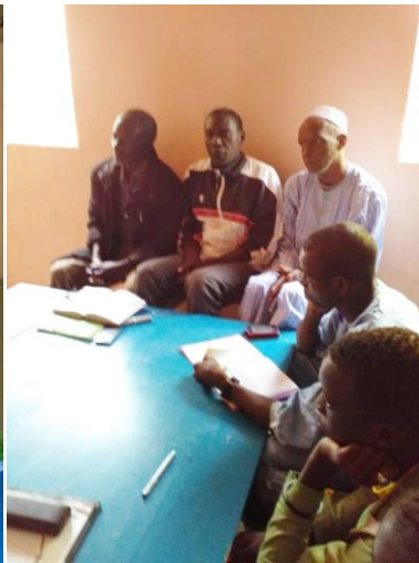
Vertegenwoordigers van wijk, ouderraad en bestuur school.

De ouderraad heeft het terrein achter de bouwplaats van onkruid ontdaan om de bakstenen er te kunnen laten drogen. De 6 e klassers stapelden de bakstenen, die nog voorhanden waren vanuit een eerdere financiering en die her en der verspreid lagen, op stapels en telden het aantal nog bruikbare bakstenen. Hierdoor konden we precies berekenen hoeveel stenen er nog bijgemaakt moesten worden.