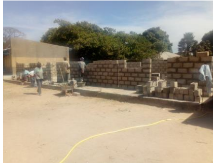
Na 1 week