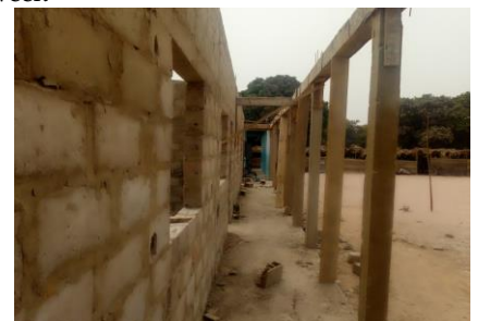
Vooraanzicht van terzijde